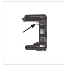
Kontaktfedern zur einfachen Rastmontage.